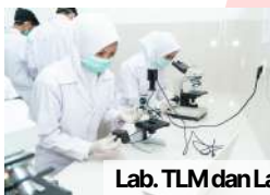
Lab. TLM dan Lab Rontgen