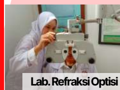
Lab. Refraksi Optisi

Universitas Kader Bangsa sebagai salah satu perguruan tinggi swasta berbasis kesehatan yang terkemuka di Palembang tentunya memiliki fasilitas-fasilitas yang sangat memadai. Seperti ruang kelas yang nyaman dilengkapi AC, LCD, WiFi dan Proyektor guna menunjang kegiatan belajar mahasiswa. Tenaga Pengajar (Dosen) dan Karyawan yang profesional di bidangnya. Serta memiliki Fasilitas Laboratorium yang lengkap dan memadai serta fasilitas gedung serbaguna.